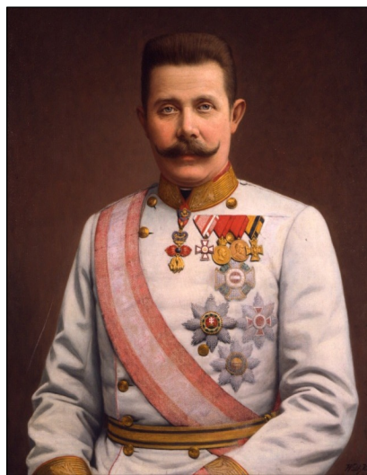
František Ferdinand d'Este (1863-1914)

Na území Bosny a Hercegoviny a obsazeného Srbska, které zaniklo, používala Rakousko-uherská armáda poštovní známky C. a K. vojenské pošty. K třetímu výročí vydala pošta tři známky s motivem Sarajeva, následníka trůnu a také společný portrét Františka Ferdinanda d'Este a Žofie Chotkové, vévodkyně z Hohenbergu. Důvodem proč tomu bylo až v roce 1917 bylo to, že za života Františka Josefa I. nepřípadala jakákoliv zmínka o vévodkyni v úvahu. Atentát považoval až do konce svého života za Boží trest za morganatický sňatek, který schválil. Až s nástupem císaře Karla I., který byl s rodinou arcivévodů v přátelském vztahu, mohla známka vyjít.