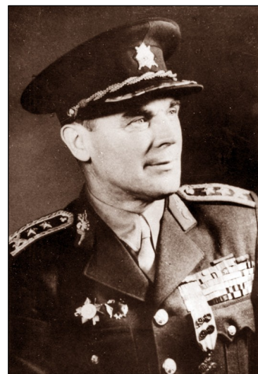
Generál Heliodor Píka (1897-1949)

Výročí atentátu je významným výročím, ale není jediným, které připadá na červen. Na 3. června připadá 90. výročí smrti spisovatele Franze Kafky. Na 6. června připadá 70 let od vylodění spojenců v Normandii, kde se vylodilo 155.000 vojáků, jen na pláži Omaha padlo během bojů 3.000 z nich.