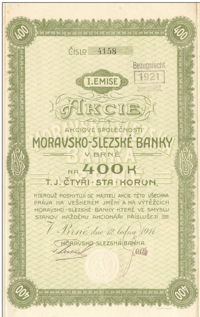
A2367 – Akcie Moravsko-slezské banky v Brně, I. emise na 400 K vydaná v Brně 12. 1. 1911, tisk UNIE v Praze