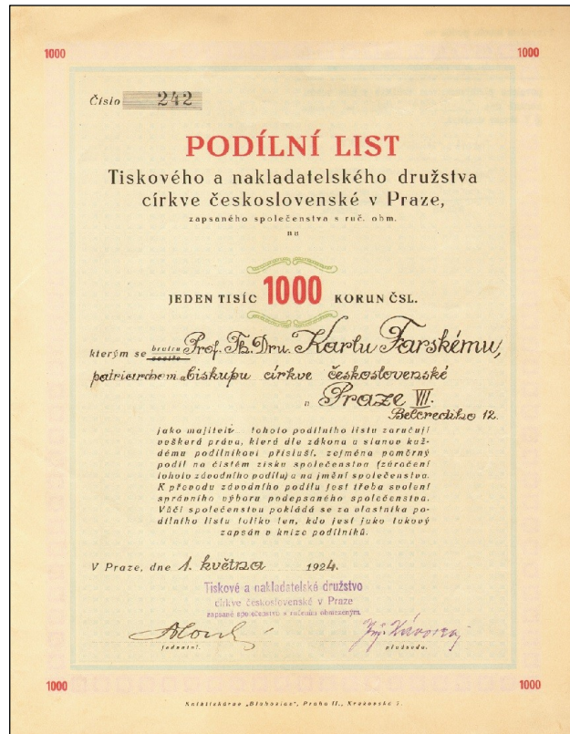
A2361 – Podílní list Tiskového a nakladatelského družstva cirkve československé v Praze na 1.000 Kč vydáný 1. 5. 1924 v Praze

S dalšími novinkami Vás seznámíme zase v příštích číslech našeho věstníku. Mezitím zase přineseme nový článek.